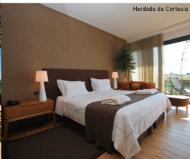
Herdade da Cortesia