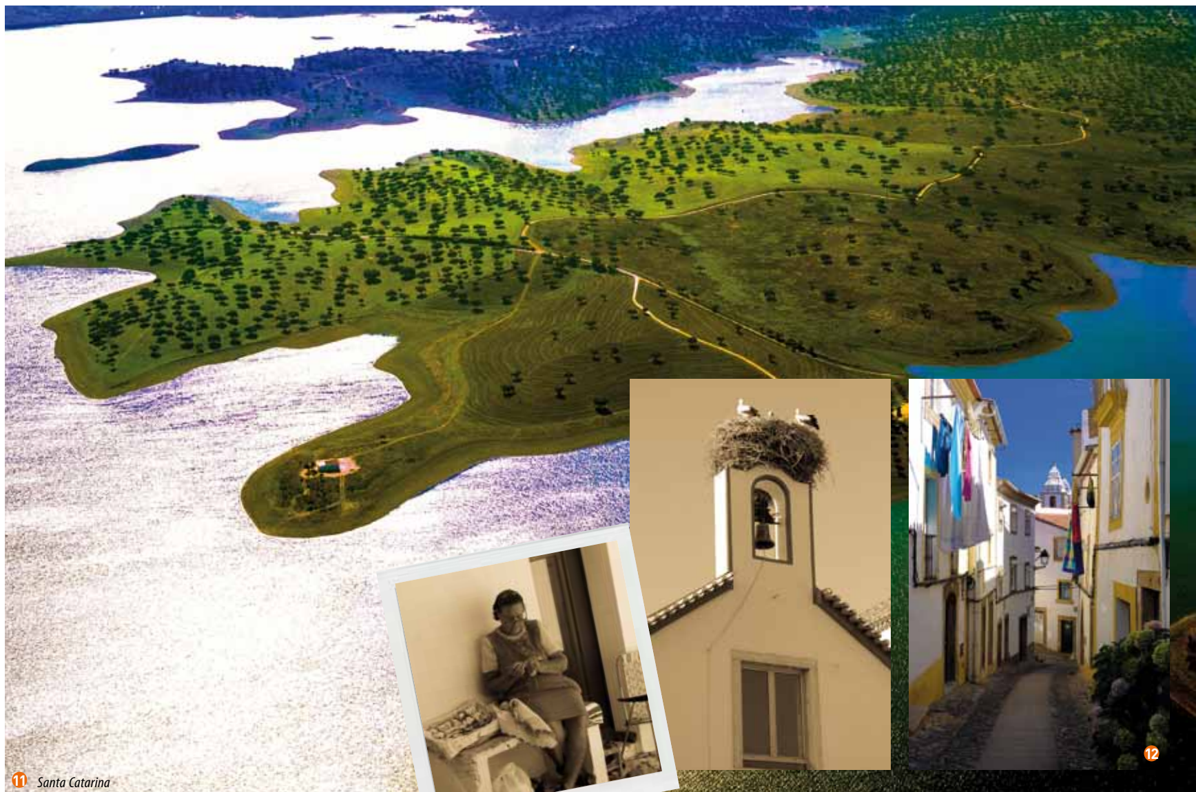
11 Santa Catarina